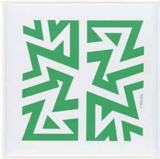
Rimatara Pannello fonoassorbente Snowsound, parete, 59 x 59 cm

Sound-absorbing Snowsound panel, wall, 59 x 59 cm