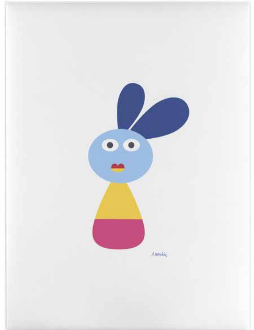
Sic Pannello fonoassorbente Snowsound, parete, 159 x 119 cm

Sound-absorbing Snowsound panel, wall, 159 x 119 cm